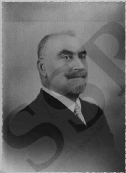
Gen. Eugenio Graziosi. Senatore del Regno